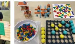
おなじみのボードゲーム

11月17日(日)、岐阜県で初めてマ ンカラの全国大会が安八町で開催され ます。「初めての方も経験者も参加で きる全国大会！マンカラで目指せ日本 一!!」のキャッチコピーのとおり、誰 でも参加できます。マンカラは世界最 古のボードゲームのひとつで、アフリ カや中近東、東南アジアなど世界で親 しまれています。ルールはシンプルで すが、初めての方でも「先を読む楽し さ」や「駆け引きの面白さ」などその 奥深さに魅了されること間違いなし。 子どもから大人まで、世代を超えて楽 しむことができます。