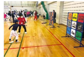
的当ての ディスクゲッター9

レクフェスの圏域イベントとして、令和元年から開催してきたミナレ ク広場。今年は大垣市、八百津町、中津川市、飛騨市にて「伝承遊びフェ スティバル」と同時開催。それぞれの会場で特色あるプログラムが用意 されており、楽しさ2倍の内容となっています。もちろん、全ての会場 で「駄菓子屋ミナレク商店」も開店。体験が終わった後は、お買い物も 楽しめます。