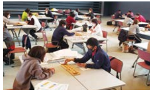
初心者でも夢中になるマンカラ