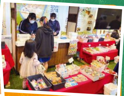
だがしや 駄菓子屋ミナレク商店