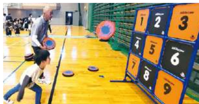
ディスクゲッター9